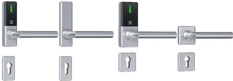
Guard Compact Slimline Breite: 40 mm