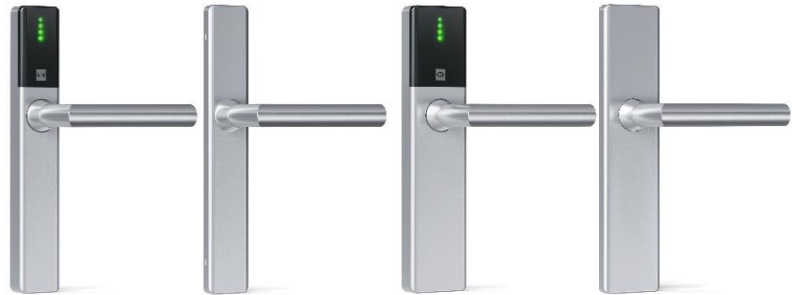
Guard Slimline Breite: 40 mm